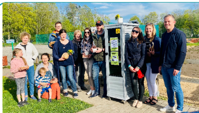
Toidukapi avamine Paldiskis.